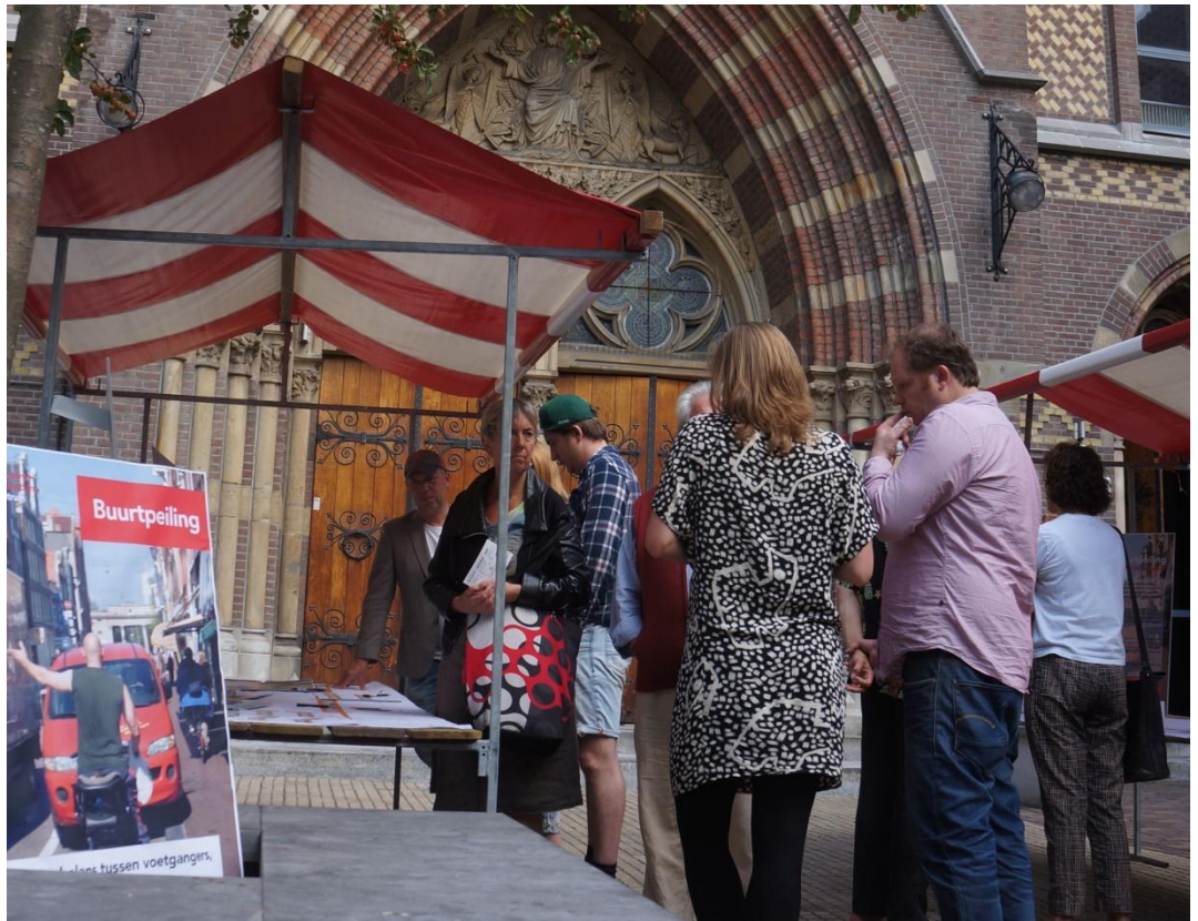
Buurtpeiling Haarlemmerstraat en -dijk

Stadsdeel Centrum vindt het van belang dat bewoners, ondernemers en instellingen actief betrokken worden bij ontwikkelingen binnen hun gebied. Het is belangrijk dat bewoners en gebruikers van het gebied met elkaar in gesprek zijn en elkaar begrijpen. De diversiteit aan kennis en ideeën die zo samenkomt, draagt bij aan betere plannen voor het gebied (of een uitwerking daarvan) en versterkt het gevoel van een gezamenlijke verantwoordelijkheid in de buurt.