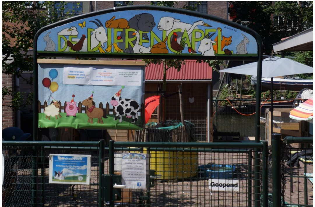
Kinderboerderij De Dierencapel, Bickerseiland