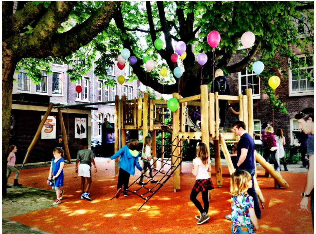
Opening speeltoestel Herenmarkt 2014